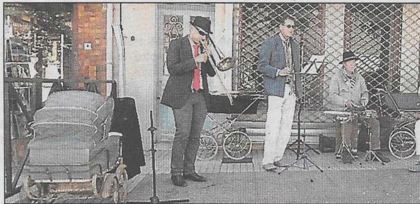
Le groupe O Sole trio pour la Sant Jordi.

L'association Chicos del sol a organisé ce samedi, place de la République, la fête de la Sant Jordi. Cette association a fait de cette journée une très grande réussite. Cette fête traditionnelle en Catalogne fait penser à une « Saint-Valentin catalane » où de jolies roses ont été offertes aux dames. Les pas-